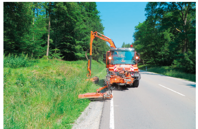
Sommer wie Winter Verantwortung zeigen