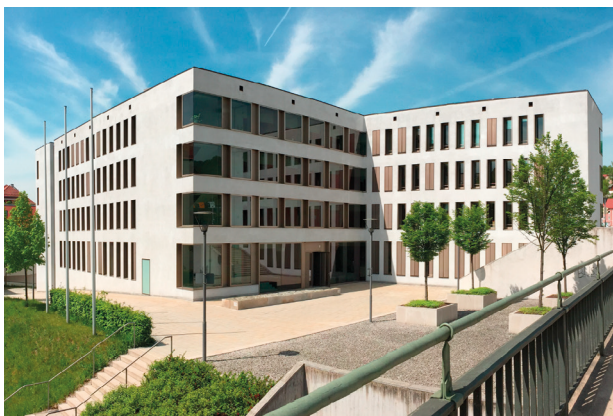
Staatliches Bauamt Passau