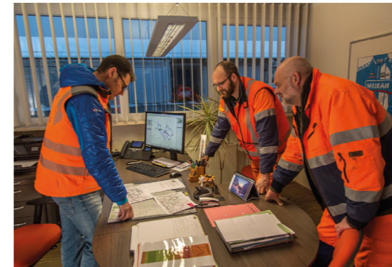
Einsatzplanung - hier ist Teamgeist gefordert

Das Staatliche Bauamt Passau ist mit neun Straßenmeistereien im östlichen Niederbayern vertreten. Die Praxisabschnitte der Ausbildung können nach Absprache grundsätzlich an jeder der Meistereien geleistet werden.