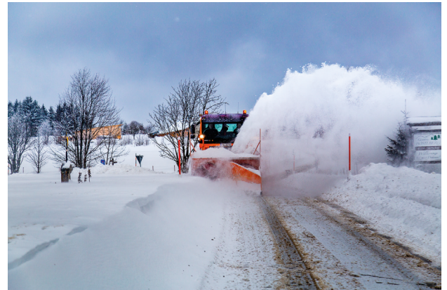
Freie Straßen - die Schneeschleuder im Einsatz