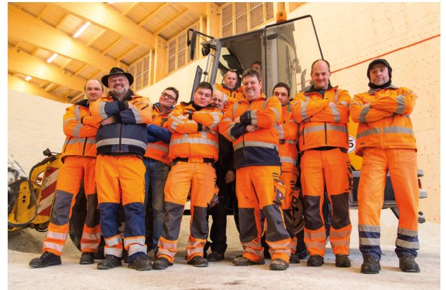
Werde Teil unseres Teams

Im Winter halten sie unsere Straßen schnee- und eisfrei, schneiden das Gehölz zurück und im Sommer werden Bankette und Rastplätze gepflegt. Die Arbeit geht nie aus und wird nie langweilig!