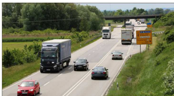
Der Verkehr auf der B20 zwischen Landau und der tschechischen Landesgrenze ist in den letzten 20 Jahren um rund 43 Prozent gestiegen. Betrachtet man nur den Schwerverkehr, ergibt sich nach Angaben des Landratsamts sogar ein durchschnittlicher Anstieg um 87 Prozent.